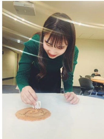
「お絵かきパキッテ」の様子